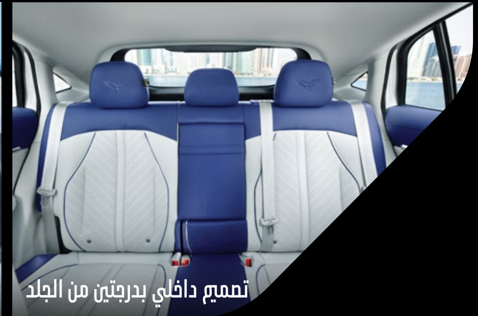
تصميم داخلي بدرجتين من الجلد