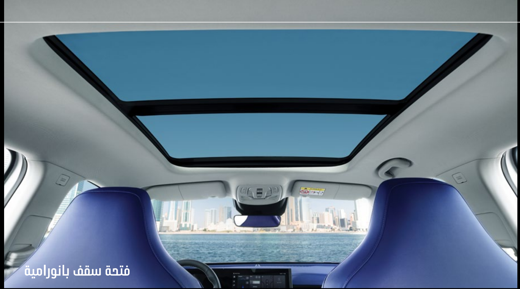
فتحة سقف بانورامية

سيارة MG WHALE تقدم تصميم داخلي فريد من نوعه مستلهم من عجاجة وهيبة الحوت، تتضح تفاصيلها باختيار الجلد من نوع (نابا) الفخم والتقليم المنحني حسب موج البحر وأيضاً برمز الحوت الخاص بسيارة MG WHALE وإضاءة المقصورة التي توحى لإنارة البحر الطبيعية التي تخلق بيئة مريحة في أي وقت ومكان.