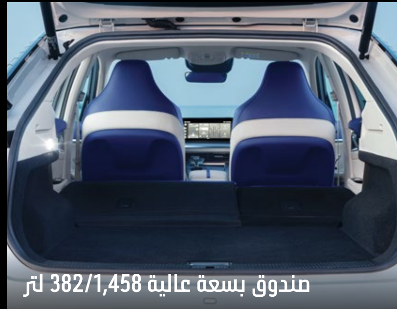
مندوق بسعة عالية 382/1,458 لتر